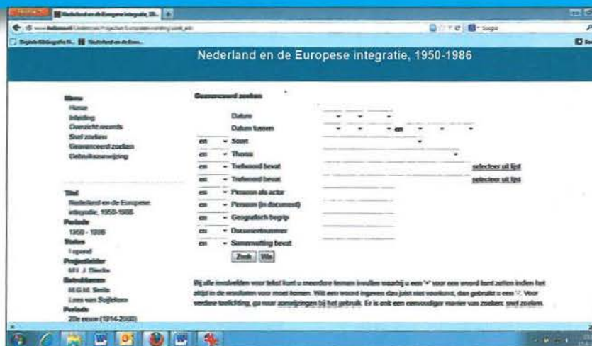
Schermafbeelding voor 'geavanceerd zoeken' in bronnenproject 'Europese integratie' van Huygens ING.

Voor de onderzoeker bieden virtuele archiefstukken belangrijke voor- en nadelen. Om met de voordelen te beginnen die verder gaan dan het obligate 'je hoeft er de deur niet voor uit': in digitale archieven, of preciezer, in collecties gedigitaliseerd archiefmateriaal kun je gewoonlijk zoeken aan de hand van (het combineren van) metadata. In de plezieriger gevallen handelt het dan om toegevoegde zoekmogelijkheden, zoals in de collectie Nederland en de Europese integratie van Huygens ING. 1