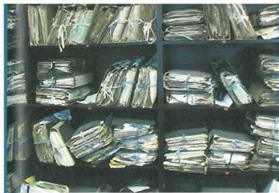
Fysieke kenmerken van dossiers kunnen de onderzoeker extra informatie verschaffen

bepaald dossier één of enkele papieren te selecteren en te bewaren in de eigen computer.